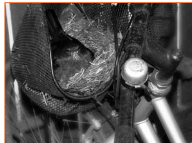
Rede i cykelkurv